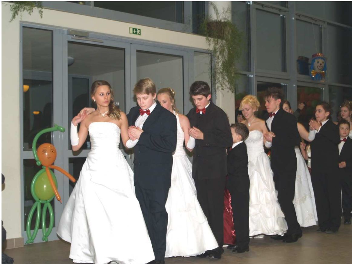
Részlet a Szülők-Nevelők Bál műsorából. Az eseményről részletesebben a következő számunkban olvashattok. – a Szerk.