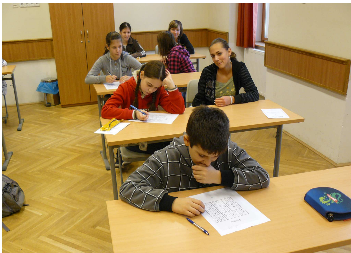
A Sudoku-verseny résztvevőinek egy csoportja.